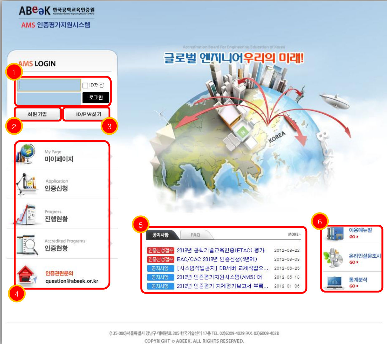
AMS 인증평가지원시스템의 로그인 전 메인 페이지